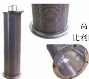
高品质的过滤介质 比利时进口楔形过滤网

然后清洗圆盘回到过滤上方，再次清洗滤芯并将残渣驱至集渣室，滤渣在集渣室浓密后很容易被快速彻底清除。